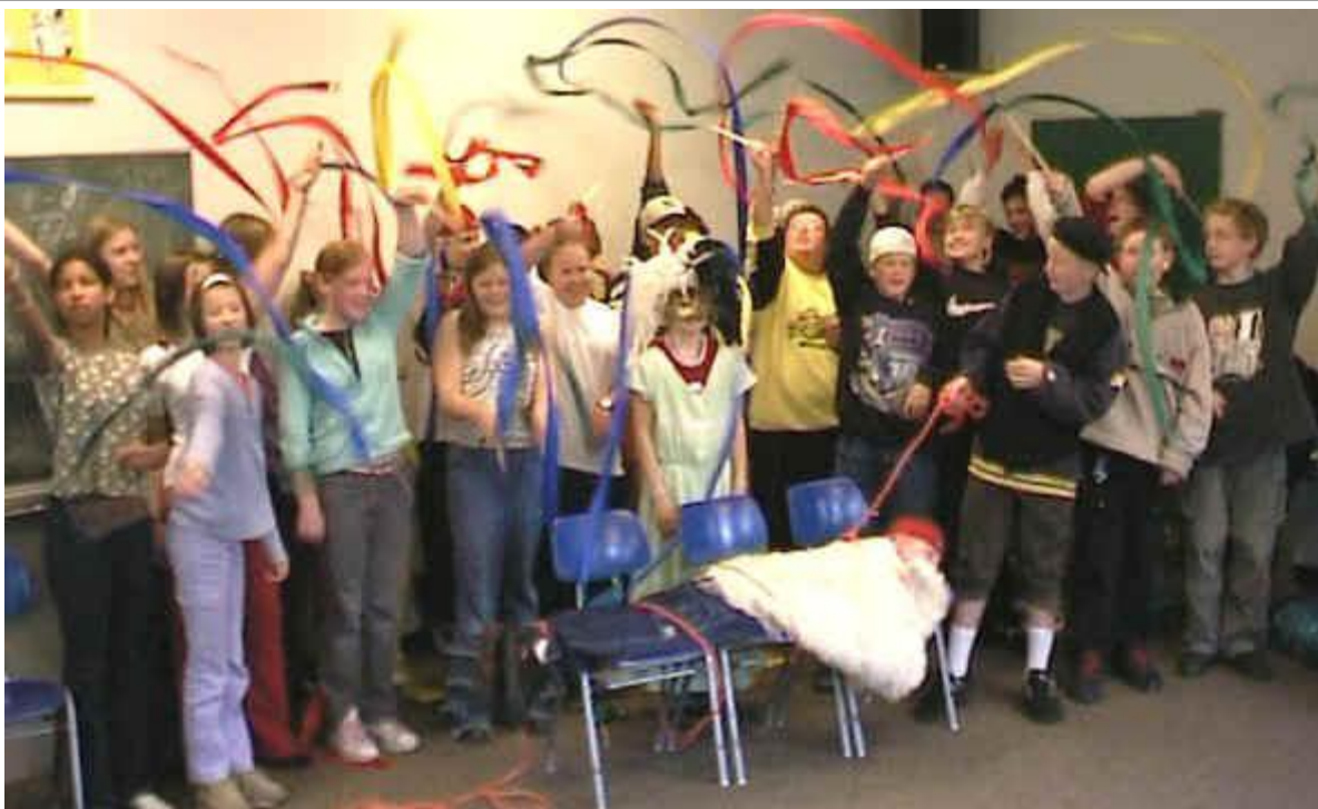
Aufführung 1: Wind lacht ohne Bezug zum Kelbl

Schwalbe verspottet das Kelbl und macht gemeinsame Sache mit dem Bauern