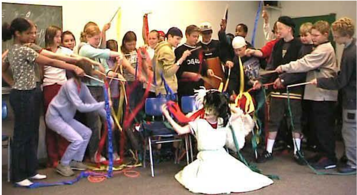
Aufführung 2: Wind lacht das Kelbl aus

Einige Verfahren der szenischen Interpretation sollten bei der Vorbereitung dieser szenischen Umsetzung eingesetzt werden: Die drei Strophen sollten zunächst jeweils in einem Standbild dargestellt und „befragt“ werden. Das Befragungsergebnis sollte in eine Präzisierung der Ausführungsdetails überführt werden.